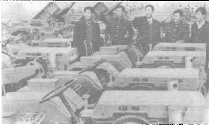
局领导在现场指导工作

十年来，引进推广各类新机具1.2万台件。先进技术的推广应用为全市创造直接经济效益1600多万元，并取得了较高的社会效益。