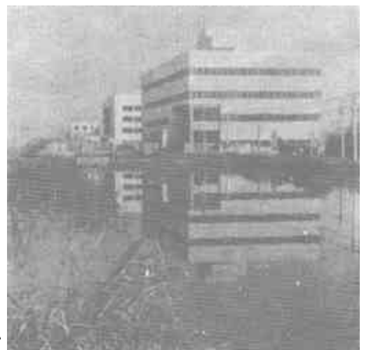
新落成的农机办公大楼。

颜徐乡大力发展农用机械。现在该乡农机开发队有东方红链式拖拉机6台及配套农具、运输队，有运输汽车5辆，还建起了配件门市部、农业机械包修站、农机维修车间、农机加油站。目前，农机总动力已发展到31500千瓦，比1982年增长了5.4倍，农用拖拉机397台，柴油机480台，电动机1485台，大中型小麦联合收割机5台、小型割晒机147台，半精量播种机180台，各种配套农具1500台件。个体农机户发展到432户，全乡48000亩耕地的耕、耙、播、收、运、脱等生产环节基本上实现了机械化，促进了全乡经济的发展。十年来农机站经济效益持续、稳定协调发展，累计完成产值467.4万元，创利税117.5万元。